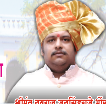
श्रीमंत युवराज जयसिंहराजे भोंसले कार्याध्यक्ष : महाराजा ऑफ नागपूर ट्रस्ट